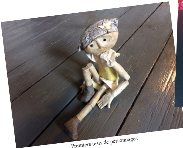
Premiers tests de personnages