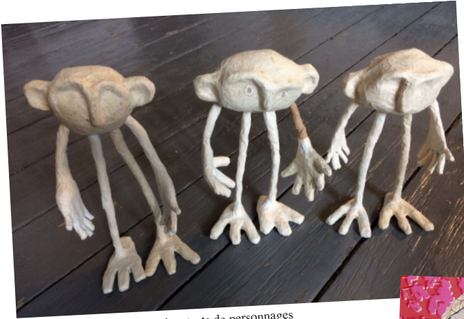
Premiers tests de personnages