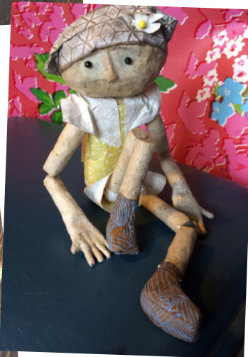
Premiers tests de personnages